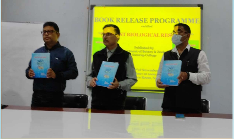
বিভাগীয় গ্ৰন্থ উন্মোচনী

প্ৰকৃতাৰ্থত আশা আকাংক্ষা বিলাক সুপথেৰে পৰিচালিত কৰি মানৱ মনৰ অনুভূতিৰ বিকাশেৰে মানৱীয় গুণসম্পন্ন হৈ থকাটোৱেই যে প্ৰকৃত জীৱন তেখেতে আমাক শিকাইছিল।।