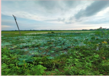
Figure 2: Aquatic vegetation at Ghinai, Kawaimari bridge(wetland) during summer season

During summer season/ Rainy season the lotus flower beautify the wetland. And whoever past through this Namrup-Rangswal Rd (Namrup-Tingkhong road) wait for moment to see the beauty of this place. Nearby people go for morning and evening walk to see the beauty of lotus flower that is blowing in this place.