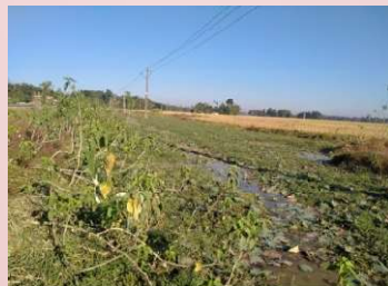
Figure 3: Ghinai, Kawaimari bridge (wetland) during winter season