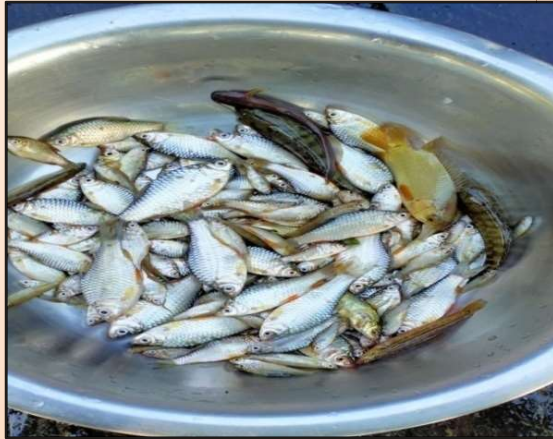
Figure 1: Fishes that are found on Ghinai ,Kawaimari bridge(Wetland)

Species of fishes that are found now a days are- Thilandmagur, Puthi , Magur, Singhi, Kawai, Goroi, Bami , Kuchia, etc and the sizes for of the fishes are smaller as compared to our grandparent time. Changes that has taken place on Ghinai ,Kawaimari Bridge(wetland).